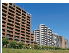
不動産・マンション管理